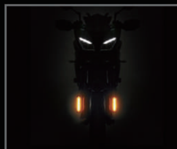
DENDNL.DRL.10100.W (WHITE) #4580041238533